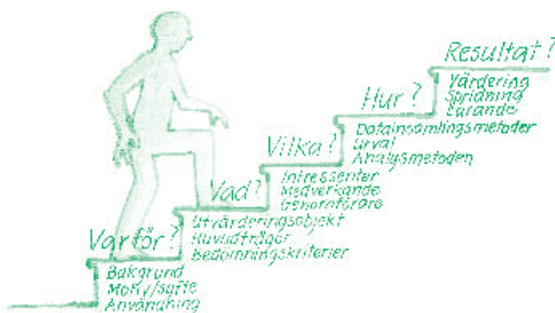
Figur 1: Skolverkets utvärderingstrappa.

Huvudfrågorna ska vara tydliga och avgränsade eftersom de påverkar utvärderingens uppbygg, genomförande och resultat.