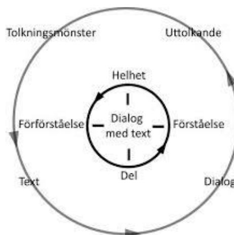
Figur 1: Den hermeneutiska cirkeln: Grundversion.

Hermeneutik är enligt Egidius (1987) konsten att tolka texter så att de stämmer med olika kunskapskällor och blir trovärdiga. Enligt Alvesson & Sköldberg (2008) kan tolkning förklaras utifrån den hermeneutiska cirkeln där forskning är en ständig rörelse mellan delen, helheten och forskarens egna förförståelse och förståelse.