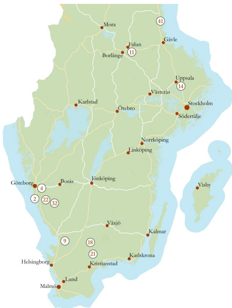
Figur 2. De inventerade kulturresevatens placering i Sverige 2019. Nr 2: Mårtagården, nr 4: Gunnebo kulturresevat, nr 9: Bollaltebygget, nr 11: Stabergs bergsmansgård, nr 14: Linnés Hammarby, nr 18: Komministerbostället Råshult, nr 21: Örnanäs, nr 22: Äskhult, nr 32: Ramsholmens odlingslandskap, nr 41: Axmar bruk.

De 10 kulturresevat som har inventerats är Axmar bruk i Gävleborgs län, Linnés Hammarby i Uppsala län, Stabergs bergsmansgård i Dalarnas län, Gunnebo kulturresevat och Ramsholmens odlingslandskap i Västra Götalands län, Mårtagården, Äskhult och Bollaltebygget i Hallands län, Komministerbostället Råshult i Kronobergs län samt Örnanäs i Skåne län (figur 2, tabell 1). Kulturresevatet Mårtagården har använts som pilotstudie för att utvärdera metoden och ingår därför inte i resultatet.