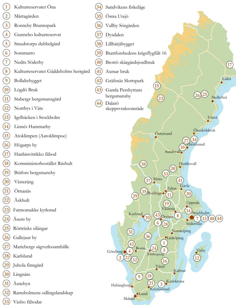
Figur 1. Kulturresevatens placering i Sverige 2019.

I Sverige finns 44 kulturresevat, utspridda över landet (figur 1). 34 av dem är statliga och bildade av länsstyrelser och 10 av dem är bildade av kommuner. Endast Kalmar län och Södermanlands län saknar kulturresevat (Riksantikvarieämbetet 2018b).