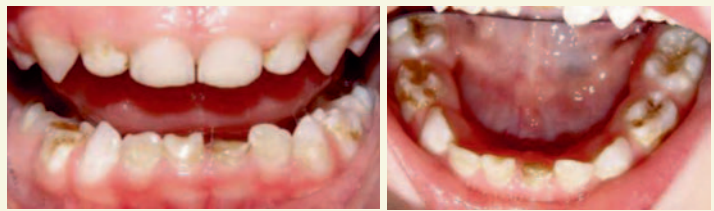
Fall 2. Fyra år gammal pojke med 22q11DS med medfött hjärtfel och omfattande medicinsk anamnes. Pojken har omfattande kariesskador och emaljvikselser.

Längre upp i åldrarna blir det uppenbart för många att de har svårigheter med koncentration, inlärning och så vidare. Upp till hälften har någon grad av utvecklingsstörning och neuro-