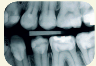
Fall 1. 23 årig man med 22q11DS. Har hypoparathyroidism och besvärar av frekventa infektioner. Stort kariologiskt behandlingsbehov.

(0–19 år) som utretts [3]. Den odontologiska delen omfattar tre separata studier som har godkänts av forskningsetisk kommitté vid Göteborgs universitet. Konsekutiva patienter som remitterats till Göteborg för utredning erbjöds att delta (tabell 1).