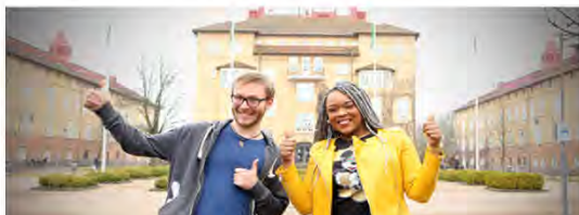
Bild 9. Högskolan Kristianstad hemsida, 2019-04-18

Antalet anmälningar till Sveriges högskolor och universitet är i princip oförändrad jämfört med förra året och likaså söktrycket till Högskolan Kristianstad. När Antagning.se stängde anmälan natten till tisdagen hade högskolan liksom föregående år sex sökande per plats. Men aldrig tidigare har högskolan haft så många sökande som prioriterat programstudier i Kristianstad högst, och alltså är Högskolan Kristianstad Sveriges mest sökta högskola.