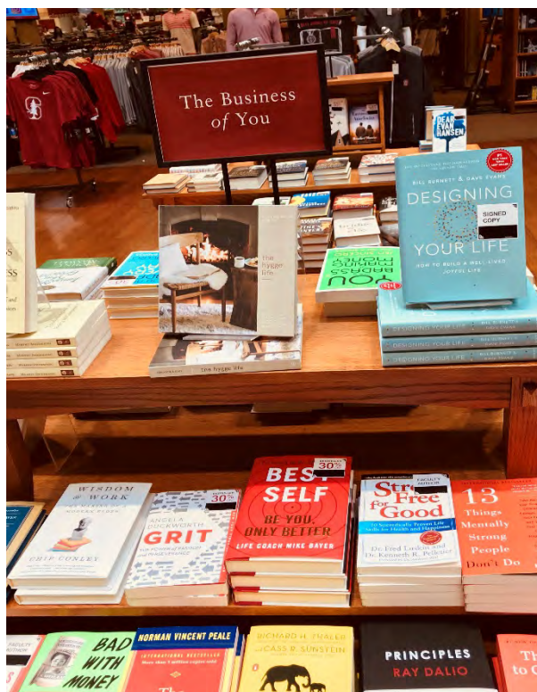
Bild 1. Stanford Bookstore

Fiction och The Business of You . Det är den sistnämnda genren som för sammanhanget är intressant. Kvintessensen med denna text, eller än hellre om poängen med denna text skulle reduceras till en mening så kan jag nog inte komma på något bättre själv än: the business of You .