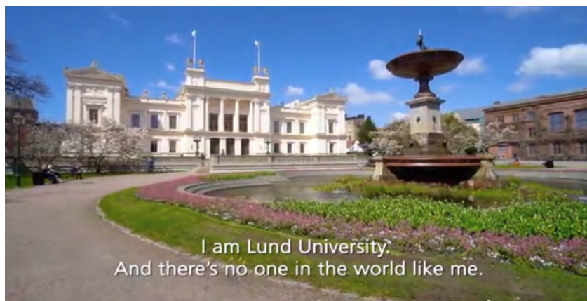
Bild 6. Välkomstsida Lunds universitet hämtat från april 2019 (Youtube-film: "I am what you make me...")